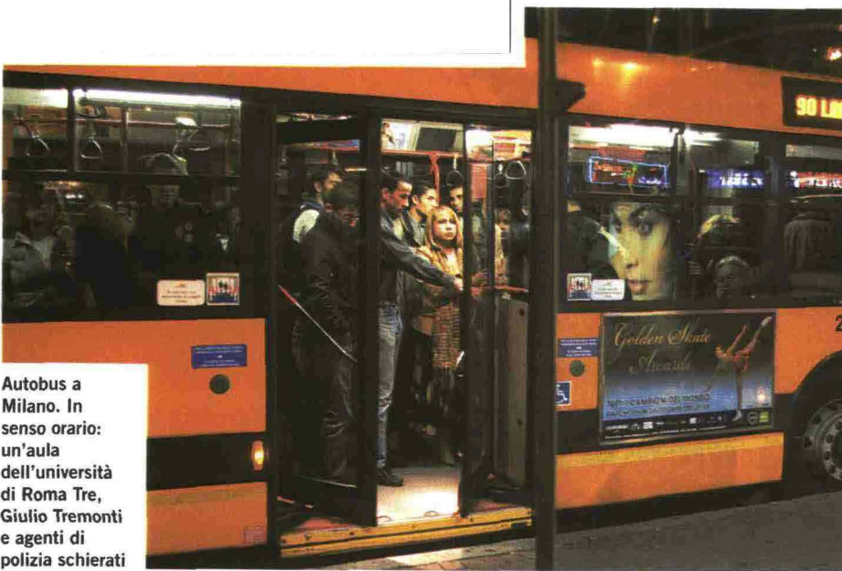
Autobus a Milano. In senso orario: un'aula dell'università di Roma Tre, Giulio Tremonti e agenti di polizia schierati