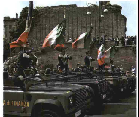
Mezzi della Finanza e delle quattro forze armate durante la parata del 2 giugno. Sotto: il ministro della Funzione pubblica Renato Brunetta